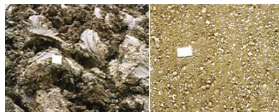
Ohne Proviacal® RD